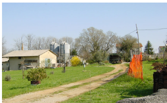
Slika 2. Merilno mesto v Opatjem selu, slikano proti severu, april 2006

Figure 1. Geographical position of meteorological station Opatje selo