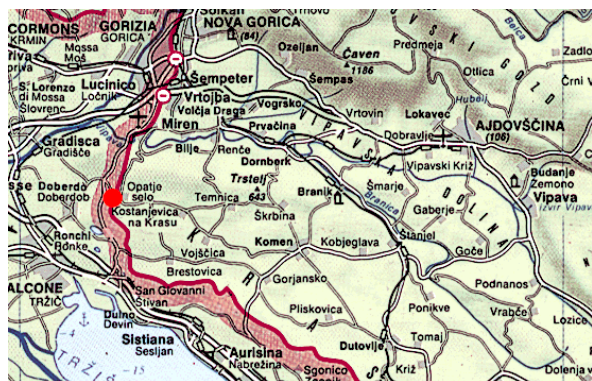
Slika 1. Geografska lega meteorološke postaje Opatje selo

A gencija RS za okolje ima eno izmed padavinskih meteoroloških postaj tudi v Opatjem selu. Opatje selo je naselje v jugozahodnem delu Slovenije, na zahodnem delu Komenskega Krasa, ob meji z Italijo.