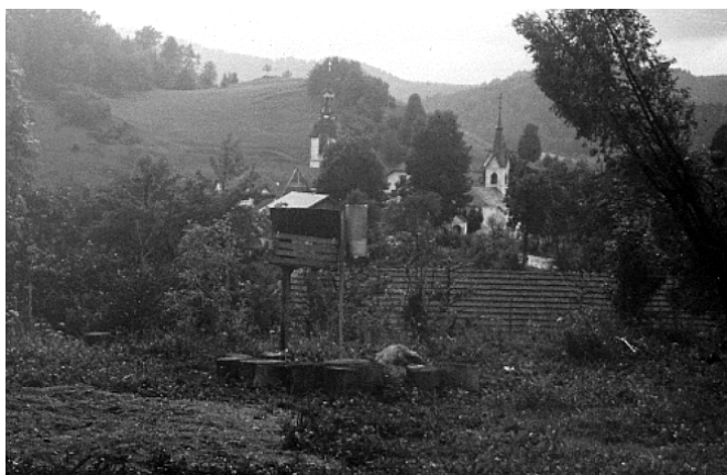
Slika 1.4.2. Ombrometer na lokaciji pred osnovno šolo v Šentjoštu leta 1973; na tej lokaciji je bil od avgusta 1970 do marca 1978.

Figure 1.4.2. Rain gauge on location near the primary school in Šentjošt in year 1973; on this location was the rain gauge from August 1970 till March 1978.