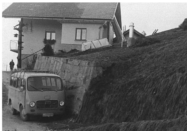
Slika 1.4.3. Ombrometer in ombrograf v Šentjoštu ob prestatitvi k opazovalki Štefki Maček leta 1978.

Figure 1.4.2. Rain gauge on location near the primary school in Šentjošt in year 1973; on this location was the rain gauge from August 1970 till March 1978.