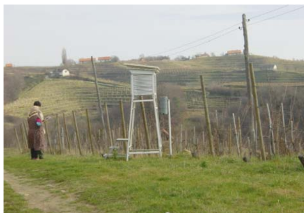
Slika 1.4.2. Opazovalni prostor meteorološke postaje v Turškem Vrhu, 26.11.2002

V Turškem Vrhu merijo temperaturo zraka na 2 m, vlago zraka, hitrost in smer vetra, padavine in snežno odejo ter opazujejo stanje tal, oblačnost in meteorološke pojave. V vinorodnem delu Haloz je tudi meteorološka postaja v Cirkulanah, v gozdnatem delu Haloz pa je postaja v Žetalah, na obeh merijo padavine, snežno odejo in opazujejo meteorološke pojave.