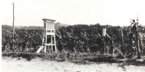
Slika 1.4.4. Opazovalni prostor v Turškem Vrhu leta 1960. Postaja je od marca 1960 do danes ves čas na isti lokaciji.