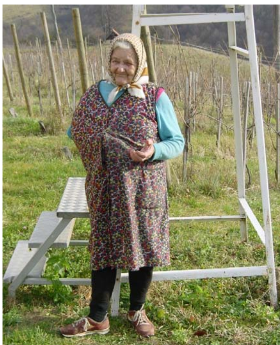
Figure 1.4.2. Observing place of meteorological station in Turški Vrh, 26 th of November 2002

Meteorološka postaja v Turškem Vrhu je na nadmorski višini 280 m, na slemenu griča. Pod postajo je južno pobočje z vinogradom, severno od postaje je opazovalna hiša, za katero se pobočje spet spušča in na njem raste gozd.